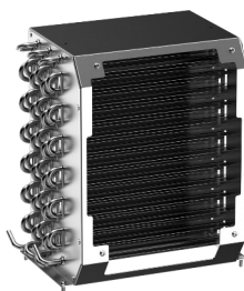
Condenseur révolutionnaire Stayclear+ à tubes ailetés alliant faible consommation d'énergie et facilité